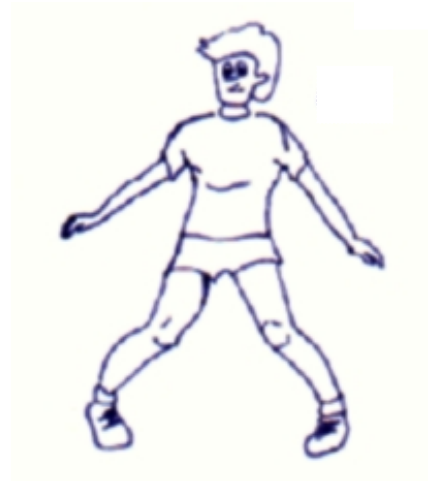
Fig.2 – Posizione di difesa