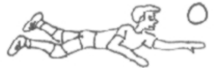
Fig.4 – Difesa in tuffo