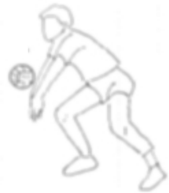
Fig.8 Difesa su palla forte