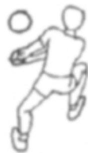
Fig.6 – Bagher Laterale