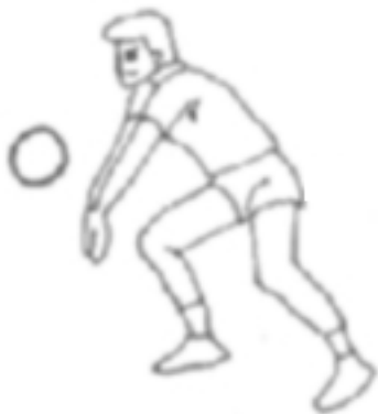
Fig.5 Difesa in fascia "B"