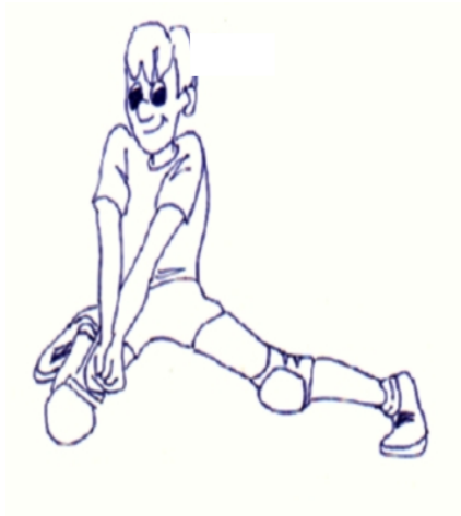
Fig.3 Caduta o Sprawl